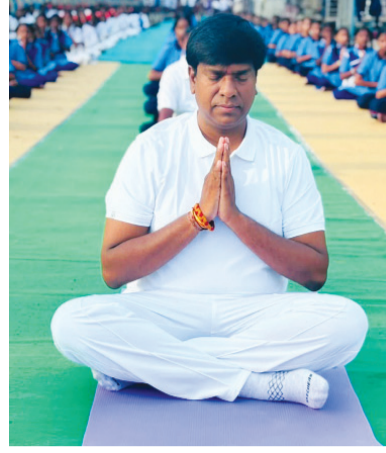
శారరక, మానసిక ఆరోగ్యాన్ని పెంపొందించడంలో

ఎమ్మిగనూరు జూన్ 21 మనం న్యూస్: పుణ్యక్షేత్రంలోని పద్మశ్రీ మాచిని సోమప్ప సర్కిల్లో ఘనంగా యోగా కార్యక్రమం లో ఎమ్మెల్యే. బీబీ మాట్లాడుతూ ముఖ్యమంత్రి నారా చంద్రబాబు నాయుడు ఆదేశాల మేరకు అంతర్జాతీయ యోగా దినోత్సవాణి పురస్కరించుకొని రాష్ట్రవ్యాప్తంగా నిర్వహిస్తున్న యోగా గ్రంథ ఆరోగ్యకరమైన జీవనశైలిని ప్రోత్సహిస్తూ ఫిట్ ఆంధ్ర - పర్ఫెక్ట్ ఆంధ్ర నిర్మాణానికి కూటమి ప్రభుత్వం కట్టుబడి ఉందనే సందేశాన్ని ప్రజల్లోకి తీసుకెళ్లే లక్ష్యంతో ఈ కార్యక్రమాన్ని నిర్వహించారు విద్యార్థిని విద్యార్థులు అధికారులు, ప్రజాప్రతినిధులు, నాయకులు, పట్టణ ప్రజలతో కలిసి యోగా సాధనలో యోగా భారతదేశం ప్రపంచానికి అందించిన అమూల్యమైన జీవన విధానమని,