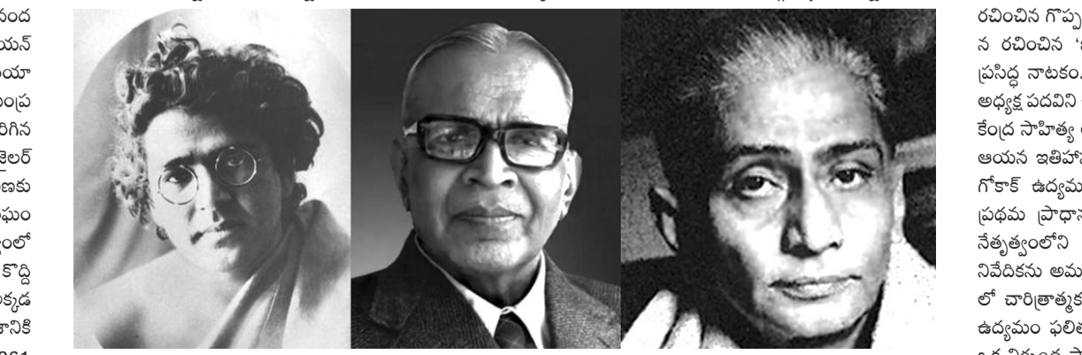
లకు జ్ఞానపీఠ పురస్కారం, 1983లో తన కవితానికే భారత భారతి పురస్కారం గొల్లెన్ రెత్తే అవార్డు అందుకున్నారు. కన్నడలో 'వి.కె. గోకాక్' సుపరిచితులైన రచయిత కృష్ణ గోకాక్. కర్ణాటకలో ప్రజాదరణ పొందిన రచయిత. విచారక కృష్ణ గోకాక్ ఆగస్టు 9, 1909లో కర్ణాటకలోని ధార వాడజిల్లాలోని సవణూరు గ్రామంలో జన్మించారు. ధారవాడ తల్లో గోకాక్ తన రచనా కృషిని మొదలు పెట్టాడు. గోకాక్ పూణెలోని ఫెర్డీనాన్ విద్యాలయంలో ఇంగ్లీషు భాష ఉపన్యాసకుడుగా నియమితుడయ్యాడు. అక్కడే కళాశాల యజ్ఞ మాసం ఆయన ప్రతిభను గుర్తించి ఇంగ్లండులోని ఆక్స్ ఫర్డ్ విశ్వవిద్యాలయానికి పంపించారు. గోకాక్ అక్కడ ఇంగ్లీషు సాహిత్యంలో మొదటి క్రికేట్ ఉత్తీర్ణుడైన ప్రథమ భారతీ