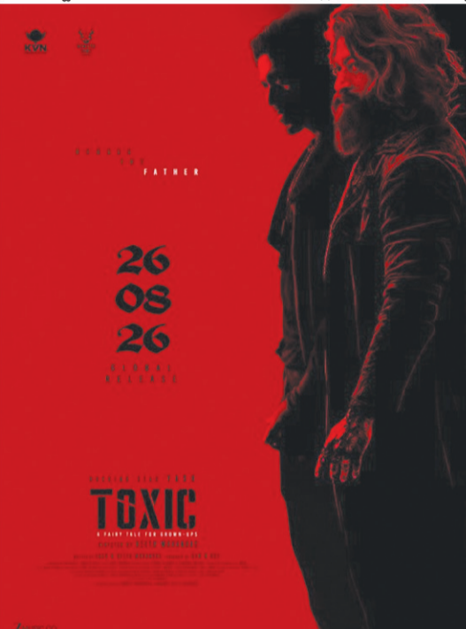
పాదర్.. ఖీజ్ కి 26-08-2026 నుంచి ప్రపంచవ్యాప్తంగా థియేటర్లలో అని వోస్ట్ చేశారు.

నటుడు యశ్ కథానాయకుడిగా, గీతూ మోహన్ దాస్ దర్శకత్వంలో తెరకెక్కుతోన్న పాన్ ఇండియా చిత్రం ‘టాక్సిక్’. ఈ సినిమా విడుదల పలుమార్లు వాయిదా పడిన విషయం తెలిసిందే. తాజాగా చిత్రబృందం కొత్త విడుదల తేదీని ప్రకటించింది. ఈ మేరకు యశ్ ‘ఎక్స్’ వేదికగా కొత్త పోస్టర్ తో పాటు విడుదల డేట్ ను వెల్లడించారు. ‘హాసర్ డై