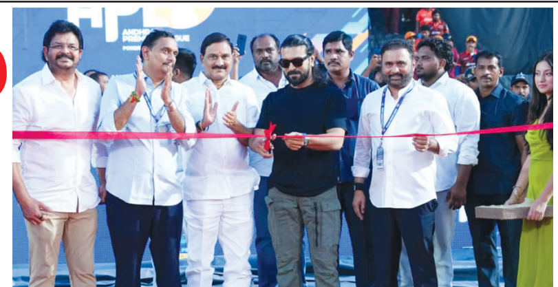
నిర్వహించనున్నారు. 27తో లీగ్ దశ ముగియనుండగా, 28 నుంచి ఫ్లైఅప్స్ ప్రారంభం కానున్నారు. ఈ నెల 30న జరిగే ఫైనల్ టోర్నీకి తెరువదనుంది. ఏడు జట్ల పోటీ పడుతున్న ఈ టోర్నీలో భీమవరం బుల్స్ ఆరు మ్యాచ్ లు వివిధ పాయింట్లతో అగ్రస్థానంలో కొనసాగుతుంది. తొలి

ఫ్లైఅప్స్ పోటీ తీవ్రం ఈ నెల 24 నుంచి 27 వరకు ప్రతిరోజూ మ్యాచ్ లు, నాయంత్రం మ్యాచ్ లు