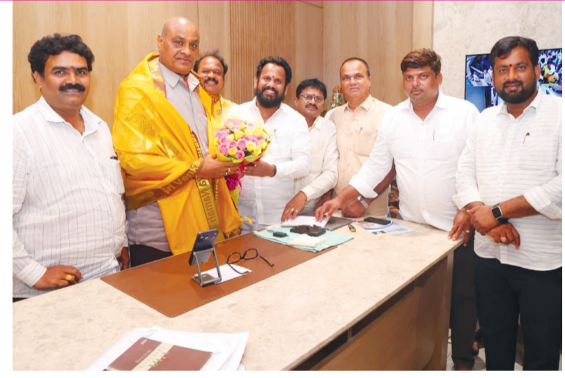
నియోజకవర్గ ప్రజల తరఫున ధన్యవాదాలు తెలియజేస్తూ, ఈ పాఠశాల మంజూరు బాలికల విద్యాభివృద్ధికి ఎంతో దోహదపడుతుందని పేర్కొన్నారు. ఎచ్చెర్లను విద్యా కేంద్రంగా మరింత అభివృద్ధి చేసే దిశగా రాష్ట్ర ప్రభుత్వం తీసుకున్న