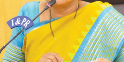
బీసీ బిడ్డలకు ఉన్నత ఉద్యోగాల లక్ష్యం

అరికట్టామన్నారు. రెండేళ్లలో రూ.80 కోట్లతో హాస్టళ్ల భవనాల మరమ్మతులు, మౌలిక సౌకర్యాల కల్పించామన్నారు.రూ.6 కోట్లతో హాస్టళ్ల దోమ తరలను ఏర్పాటు చేశామని, రూ.18 కోట్లతో వసతి గృహాలకు అవసరమైన వంటపాత్రలను విద్యార్థులకు అవసరమైన సామాగ్రి కొనుగోలు చేశామని తెలిపారు. వసతి గృహాల్లో రూ.16.85 కోట్లతో 772 ఆరోగ్య ఫ్లోయర్లు ఏర్పాటు చేశామన్నారు. సీనియర్ కెమెరాలతో పాటు నిరంతర విద్యకు 642 వసతి గృహాల్లో ఇన్ఫర్మర్ల ఏర్పాటు చేశామన్నారు. రూ.4 కోట్లతో బట్టలు అరేస్ స్టాండ్లు, వాల్ హ్యాంగింగ్ ఏర్పాటు చేస్తున్నామన్నారు. వసతి గృహ పిల్లలకు నాణ్యమైన, రుచికరమైన భోజనం అందించడానికి సన్న బియ్యం సరఫరా చేస్తున్నామన్నారు. 260 మంది కుక్కలు, కమాటీలను నియమించామని, త్వరలో మరో 142 మందిని నియమించబోతున్నామని తెలిపారు. హాస్టళ్లలో పారిశుధ్య నిర్వహణకు 1,291 పారిశుధ్య ఏర్పాటులను, రుచికరమైన భోజనం అందించడానికి సన్న బియ్యం సరఫరా చేస్తున్నామన్నారు. 260 మంది కుక్కలు, కమాటీలను నియమించామని, త్వరలో మరో 142 మందిని నియమించబోతున్నామని తెలిపారు. హాస్టళ్లలో పారిశుధ్య నిర్వహణకు 1,291 పారిశుధ్య ఏర్పాటులను, రుచికరమైన భోజనం అందించడానికి సన్న బియ్యం సరఫరా చేస్తున్నామన్నారు. 260 మంది కుక్కలు, కమాటీలను నియమించామని, త్వరలో మరో 142 మందిని నియమించబోతున్నామని తెలిపారు.