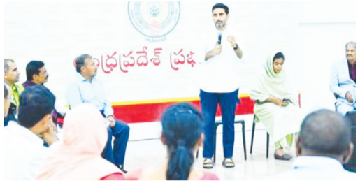
తాడేపల్లి, జూన్ 26, మనం న్యూస్: రాష్ట్రంలో చంద్రబాబు నాయుడు ప్రజా ప్రభుత్వం టీచర్లను లీడర్లు భావిస్తోంది, కష్టపడి మంచి ఫలితాలు సాధించే ఉపాధ్యాయులకు ప్రత్యేక గుర్తింపునిస్తామని రాష్ట్ర విద్య, ఐటీ, ఎలక్ట్రానిక్స్ శాఖల మంత్రి నారా లోకేశ్ పేర్కొన్నారు. ఇటీవలే సింగపూర్ అధ్యయన యాత్రకు వెళ్లిన 37మంది ఉత్తమ ఉపాధ్యాయులతో మంత్రి లోకేశ్ ఉండవల్లి నివాసంలో సమావేశమయ్యారు. సింగపూర్ అధ్యయన యాత్రలో తాము తెలుసుకున్న అంశాలు, రాష్ట్రంలో వాటిని అమలు చేయడానికి గల అవకాశాలను వారు మంత్రికి వివరించారు. ఈ సందర్భంగా మంత్రి లోకేశ్ మాట్లాడుతూ..

విద్యావ్యవస్థలో మార్పునకు ఉపాధ్యాయులు నాయకత్వం వహించాలి రాష్ట్రంలో టీచర్లంతా ఛేంజ్ మేకర్లుగా, నాయకులుగా తయారుకావాలి కష్టపడి మంచి ఫలితాలు సాధించే ఉపాధ్యాయులకు గుర్తింపునిస్తాం రాష్ట్ర విద్యావ్యవస్థలో సంస్కరణల వల్లే సైవేటు నుంచి లక్షమంది చేరిక అందరం కలిసికట్టుగా ఏపీ మోడల్ ఆఫ్ ఎడ్యుకేషన్ సాధిస్తాం విద్యారంగంలో ఆంధ్రప్రదేశ్ ను నెం.1గా నిలబెడతాం సింగపూర్ అధ్యయన యాత్రకు వెళ్లిన టీచర్లతో మంత్రి లోకేశ్ సమావేశం