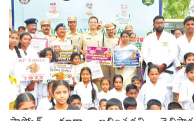
పాస్పోర్ట్ కూడా లభించదని తెలిపారు. పాఠశాలలు, కళాశాలల పరిసరాల్లో 'కూల్ లిమ్స్' లాంటివి అమ్ముతే కఠిన చర్యలు తప్పవు. ఉపాధ్యాయులు సైతం అప్రమత్తంగా ఉండి విద్యార్థుల బ్యాలెన్లను తనిఖీ చేయాలన్నారు. ఇప్పటికే జిల్లాలోని అన్ని పోలీసు స్టేషన్లకు 'డ్రగ్ టెస్టింగ్ కిట్స్' సరఫరా చేశారు. అనుమానితులకు