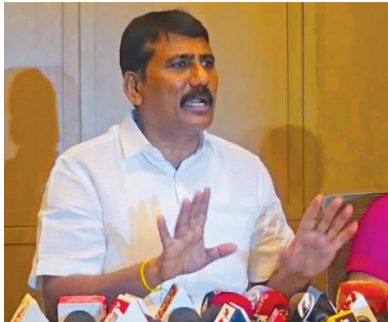
అతిపెద్ద అవినీతి పరుడు పులివెందుల వారి అభివృద్ధి పని చేయాలన్నానానీకి ముదుపు చేరాలి

కూటమిలో కుదుపులు మొదలై అంతర్గత విభేదాలు మరసారా బహిష్కరణయ్యాయి. ఇప్పటికే జనసేన నాయకుల నుంచి విమర్శలు ఎదురవుతున్న డీజీపీ ఎమ్మెల్యే పులివెందుల వారి అభివృద్ధి పని చేయాలన్నానీకి ముదుపు చేరాలి