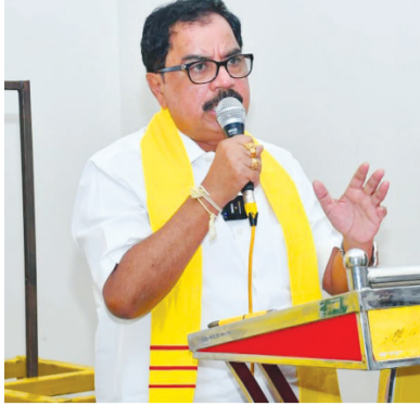
చంద్రబాబు కి, విద్యా శాఖ మంత్రి నారా లోకేశ్ గారికి కృతజ్ఞత సభను ఉపాధ్యాయులు ఏర్పాటు చేసారు..అక్కడే ముఖ్యమంత్రి చంద్రబాబు

ఎమ్మెల్యే అమిలినేని సురేంద్రబాబు కళ్యాణదుర్గం జూన్ 26 మనం న్యూస్: మాటలు చెప్పి వాటిని విన్నవించే ప్రభుత్వం కాదని చెప్పకపోయినా చేతల్లో చూపించే ప్రభుత్వం కూటమి ప్రభుత్వం అందులో ముఖ్యమంత్రి చంద్రబాబు నాయుడు, విద్యా శాఖ మంత్రివర్యులు నారా లోకేశ్ కి దక్కకుండాని ఎమ్మెల్యే అమిలినేని సురేంద్ర బాబు పేర్కొన్నారు.. కుకనాం ప్రజావేదిక నందు రాష్ట్ర ప్రభుత్వం 2004 కంటే ముందు ఉద్యోగాలు పొందిన వారికి నేడు రాష్ట్ర ప్రభుత్వం పాత పెన్షన్ విధానం అమలు చేసినందుకు గాను స్టానిక ఎమ్మెల్యే అమిలినేని సురేంద్ర బాబు గారికి, రాష్ట్ర ముఖ్యమంత్రి