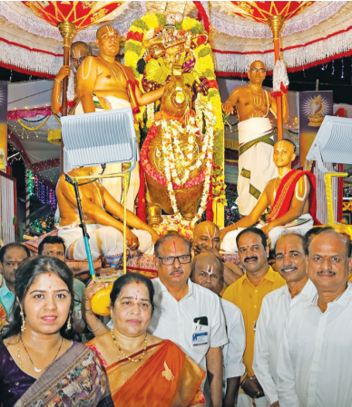
నామస్మరణతో మండవీడులను మారుమోగించారు. శనివారం ఉదయం

అలంకారంలో దర్శనమిచ్చిన శ్రీ ప్రసన్న వేంకటేశ్వరస్వామివారు భక్తులను విశేషంగా అనుగ్రహించారు. హంస మంది, చెడులను గుర్తించి మందిరానినే స్వీకరించే జ్ఞానానికి ప్రతీక. సరస్వతీదేవి వాహనమైన హంసపై విహరించిన స్వామివారు భక్తులు నిర్మలమైన మనస్సుతో, మంచి ఆలోచనలతో జీవించాలని, అలాంటి వారి హృదయాల్లో తాను ఎల్లప్పుడూ కొలువై ఉంటాననే దివ్య సంకేతాన్ని అందించారు. భక్తి, సంగీతం, వేదఘోషల నడుమ దివ్యోత్సవవేదఘోషలు, మంగళవాద్యాలు, భజన మండళ్ల గానామృతం, కోలాటాల మధ్య సాగిన హంసవాహన సేవ భక్తులను ఆధ్యాత్మిక పరవశంలో ముంచెత్తించింది. స్వామివారి దివ్య రూపాన్ని దర్శించిన భక్తులు గోవింద