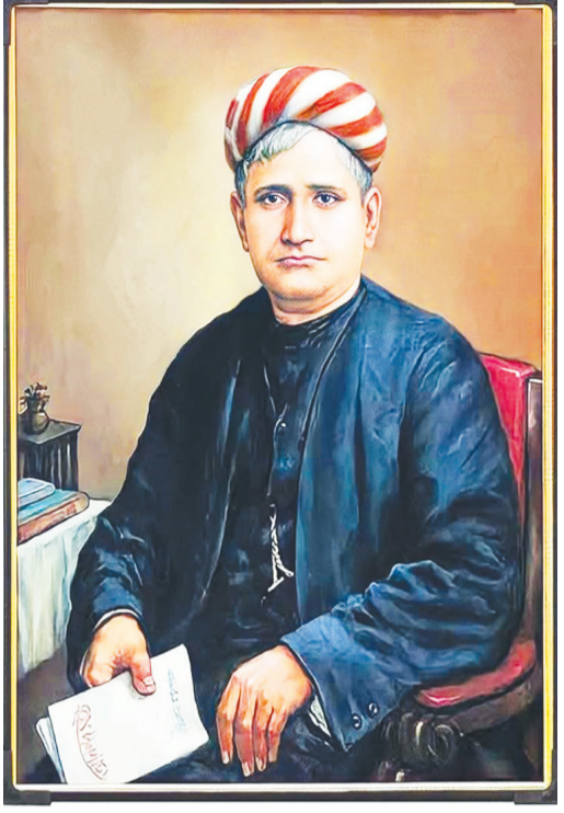
వనిచేసింది. దేశమంతటా ప్రతిధ్వనించిన నినాద ముంది. దేశాన్ని మాతృమూర్తిగా సంబోధిస్తూ, దేశభక్తిని ప్రబోధిస్తూ, 'వందేమాతరం' గీత రచన చేసిన తర్వాత దానిని 'అనంద్మోహన్' నవలలో పొందుపరిచారు. ఈ నవల ద్వారా భారతీయ భాషలలో నీతి అనుబంధించ బడడం వలన వందేమాతరం గేయం దేశవ్యాప్తంగా ప్రచారాన్ని పొందింది. ఈ గేయాన్ని బహురంగంగా గానం చేయటాన్ని నాటి ప్రభుత్వం నిషేధించింది. రవీంద్రుడు బాణేశ్వరీ నిషేధాజ్ఞలను ఉల్లంఘించి 1896 కాంగ్రెస్ సభలలో గానం చేశాడని చెబుతారు. భారతదేశ స్వాతంత్ర్య ఆరాధక ప్రజల్లో చైతన్య వంత ముపుతున్నప్పుడు వందేమాతరం గీతం ఆ చైతన్యాన్ని వేగవంతం చేసింది.

దేశాన్ని మాతృమూర్తిగా సంబోధిస్తూ, దేశభక్తిని ప్రబోధిస్తూ, 'వందేమాతరం' గీత రచన చేసిన ర తర్వాత దానిని 'అనంద్మోహన్' నవలలో పొందు పరిచారు. ఈ నవల వివిధ భారతీయ భాషలలో నీతి అనుబంధించబడడం వలన వందేమాతరం గేయం దేశవ్యాప్తంగా ప్రచారాన్ని పొందింది. ఈ గేయాన్ని బహురంగంగా గానం చేయటాన్ని నాటి ప్రభుత్వం నిషేధించింది. రవీంద్రుడు బాణేశ్వరీ నిషేధాజ్ఞలను ఉల్లంఘించి 1896 కాంగ్రెస్ సభలలో గానం చేశాడని చెబుతారు.