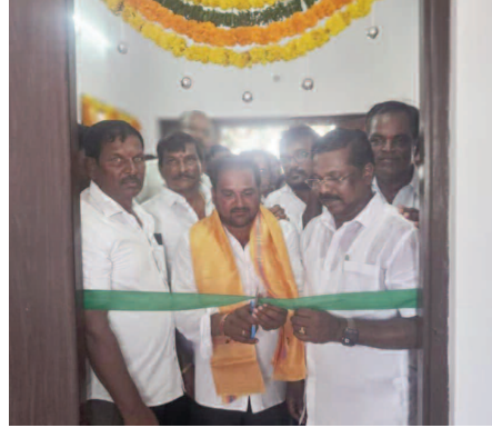
కాంగ్రెస్ పార్టీ నాయకులు, కార్యకర్తలు, గ్రామ పెద్దలు మరియు గ్రామస్థులు పెద్ద ఎత్తున పాల్గొన్నారు.

ఈ కార్యక్రమంలో ప్రజాప్రతినిధులు, అధికారులు,