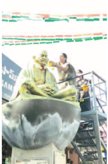
పాత్రికేయులు- ప్రింట్ అండ్ ఎలక్ట్రానిక్ మీడియా మిత్రులు పాల్గొని తెలంగాణ రాష్ట్ర ఆవిర్భావ దినోత్సవం ఘనంగా నిర్వహించుకోవడం జరిగింది.