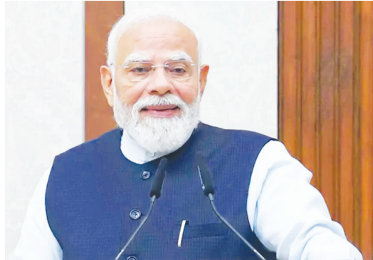
వర్షాకాల సమావేశాల్లోపే పునర వ్యవస్థీకరణ! గవర్నర్లుగా కొందరికి..

పార్టీలో ఇంకొందరికి అవకాశం బీజేపీ గూటికి చేరినవారికి పదవులు