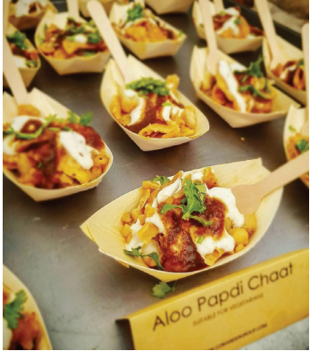
గాంధీనగర్ జూన్ 3 మనం న్యూస్: వాడి పారసే ఫ్లాస్టిక్ వస్తువుల వినియోగం పెరుగుతున్న నేపథ్యంలో పర్యావరణ అనుకూల ఉత్పత్తులను అందుబాటులోకి తీసుకువచ్చిన హైదరాబాద్

వెందిన 'సోమాని ప్యాకేజింగ్' సంస్థ దేశవ్యాప్తంగా విశేష గుర్తింపు పొందుతోంది. అమెజాన్ యాప్ ద్వారా అమ్మకాలు విస్తరించడంతో ఈ సంస్థ లక్షలాది ఫ్లాస్టిక్ వస్తువులకు ప్రత్యామ్నాయంగా నిలుస్తూ పర్యావరణ పరిరక్షణలో కీలక పాత్ర పోషిస్తోంది. 2014లో హైదరాబాద్ ప్రారంభమైన 'సోమాని ప్యాకేజింగ్' సంస్థ పర్యావరణానికి హాని చేయని ప్యాకేజింగ్ ఉత్పత్తులను అందరికీ చేరువ చేయాలనే లక్ష్యంతో ఏర్పాటైంది. ప్రారంభ దశలో పర్యావరణ అనుకూల ఉత్పత్తుల వినియోగం పరిమితంగానే ఉన్నప్పటికీ, క్రమంగా వినియోగదారుల్లో అవగాహన పెరగడంతో సంస్థ వ్యాపారం విస్తరించింది. ముఖ్యంగా అమెజాన్ ఇండియా వేదికగా ఉత్పత్తులను విక్రయించడం ద్వారా దేశవ్యాప్తంగా వినియోగదారులకు చేరువ