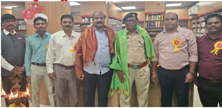
ఫునంగా మెడ్ ప్లస్ ఔషధ