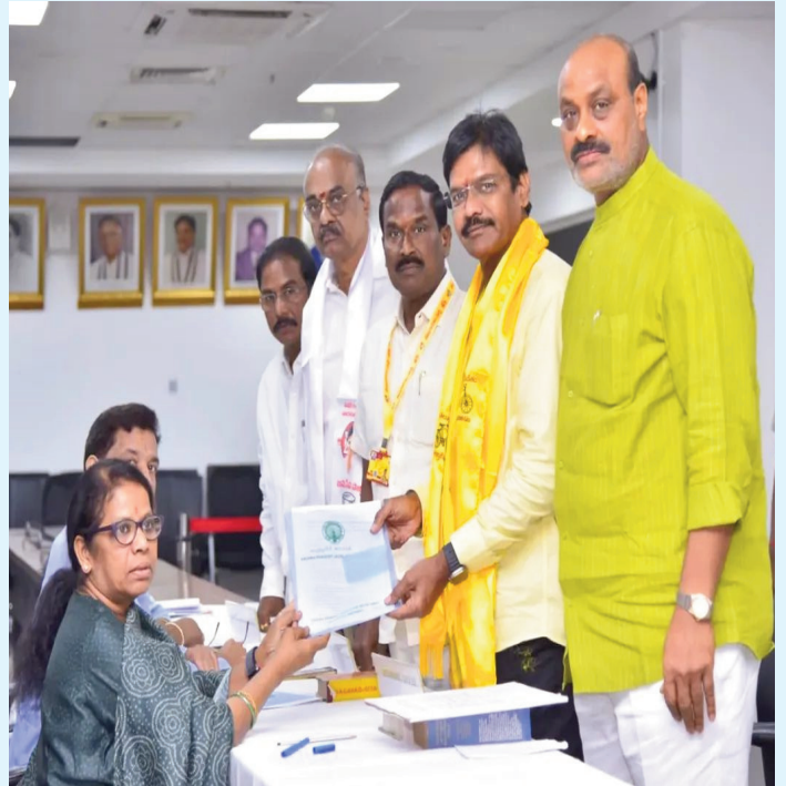
▶ సోమవారం అసెంబ్లీ ప్రాంగణంలో నామినేషన్ పత్రాలు దాఖలు