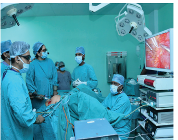
200 మందికి పైగా వైద్యుల హాజరు

విజయవాడ, సెంట్రల్ జూన్ 8 (మనం న్యూస్): నగరంలోని క్యాపిటల్ ఆస్పత్రిలో ఆంధ్రప్రదేశ్ మెడికల్ కౌన్సిల్ (ఎపిఎంసీ), ఇండియన్ మెడికల్ అసోసియేషన్ (ఐఎంఏ) విజయవాడ చాప్టర్ సంయుక్త ఆధ్వర్యంలో ఆదివారం 'లైవ్ అడ్వాన్స్డ్ మినిమల్ ఇన్వేసివ్ గైనకాలజీ వర్క్ షాప్' నిర్వహించారు. అన్నయ