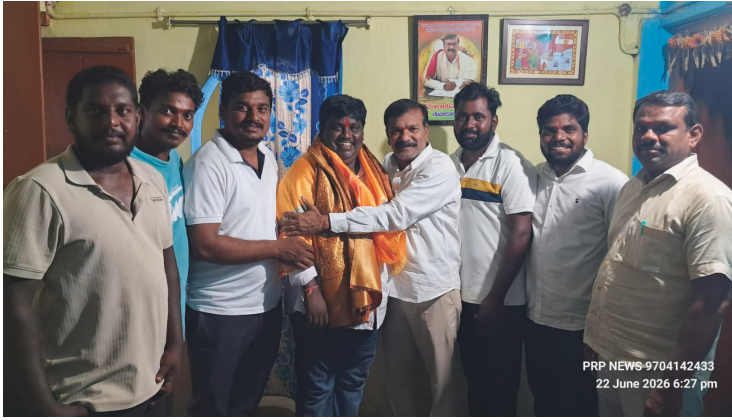
PRP NEWS 9704142433 22 June 2026 6:27 pm