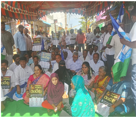
అదవులు... నేడు ఎవరని తలపిస్తున్నాయి. గతంలో ఎప్పుడు లేని విధంగా నియోజకవర్గంలో అవినీతి తారాస్థాయికి