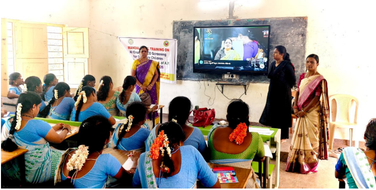
సాధారణ అభివృద్ధి లక్షణాలు, ఎదుగుదలలో జాప్యం ఉన్న పిల్లలను గుర్తించే విధానం, పిల్లల మెదడు అభివృద్ధికి తోడ్పడే