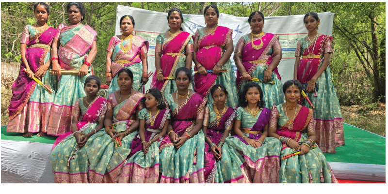
నేడు పవిత్ర పుణ్యక్షేత్రమైన తిరుపతి తిరుపతి దేవస్థానం వారు ర్యాల్లిని నిర్వహించారు. గోమయంతో గోమాత్రంతో అగరలక్షిలు లాగా అనేక రకాలుగా

తిరుపతి జూన్ 8 మనం స్టూన్ : గోవుల సంరక్షణకై గోమాతను రక్షిద్దామంటూ భారీగా ర్యాల్లిని గోపాల్ ఆధ్వర్యంలో నిర్వహించారు. ఆదివారం స్థానిక డివ్యూరామంలో " కాపాడుదాం కాపాడుదాం భూమాతను కాపాడుదాం " రక్షిద్దాం రక్షిద్దాం గోమాతను రక్షిద్దాం " అనే నినాదాలతో గో సంరక్షిత ప్రమితులు, అలాగే ఎన్.సి.సి విద్యార్థులు మరియు మహిళా కోలాట బృందం స్థానికలతో కలిసి భారీగా ర్యాల్లిని నిర్వహించి గోమాత యొక్క ప్రాముఖ్యతను విశిష్టతను వివరించారు. ఈ సందర్భంగా పలువురు మాట్లాడుతూ గోవు హింసలపై యొక్క ఆరాధ్య దేవాల నిలయమైన గోవును పూజించిన సకల దేవతలకు పూజించిన భాగ్యం కలుగుతుందని . అంతేకాకుండా గోమాత్రము గోమయము తో మానవులకు అన్ని విధాలా ఉపయోగపడేలా వాటి గోవుతనం గురించి తెలియజేస్తూ