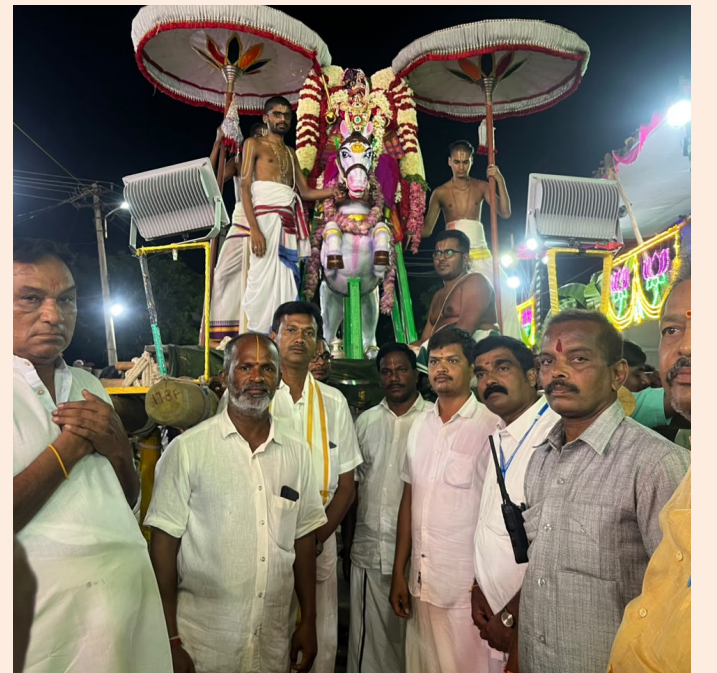
కార్వేటి నగరం, జూన్ 13: కార్వేటి నగరం రుక్మిణి సత్యభామ సమేత వేణుగోపాలుస్వామి ఆలయం బ్రహ్మోత్సవాలలో ఎనిమిదవ రోజు రాత్రి అశ్వ వాహనంపై కల్కి అవతారం లో భక్తులను కటాక్షించిన స్వామివారు..