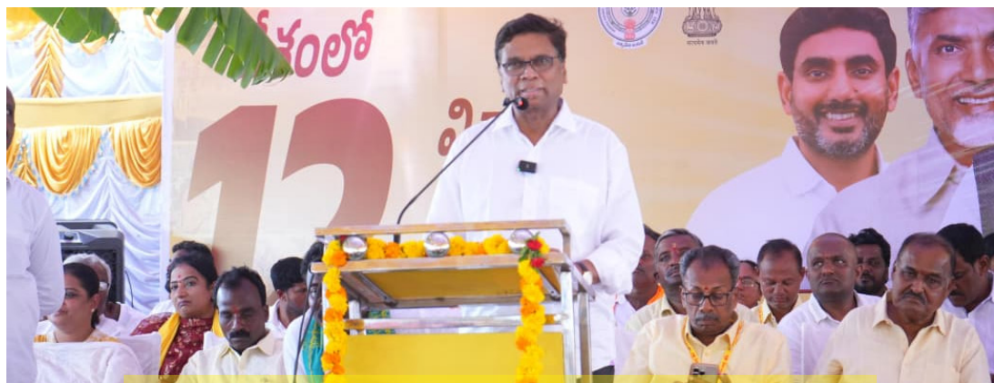
ప్రజా సంక్షేమం కోరి కూటమి ప్రభుత్వం తీసుకొస్తున్న