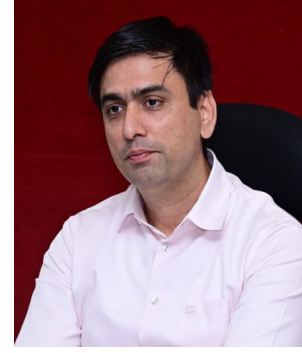
శ్రీనివాసపురం తదితర ప్రాంతాలను సందర్శించి రైతులు, వ్యాపారులు, ప్రాసెసింగ్లో చర్చలు జరిపాయని వెల్లడించారు. ప్రస్తుతం ఉన్న పరిస్థితులను పరిశీలిస్తే రాబోయే పది రోజులలో మార్కెట్లో నిల్వలు తగ్గి వినియోగం పెరగడం వల్ల ధరలు కొంత మేర మెరుగుపడే అవకాశం ఉందని ఆశాభావం వ్యక్తం చేశారు. తోతాపురి మామిడి రైతుల సమస్యల పరిష్కారానికి జిల్లా యంత్రాంగం కట్టుబడి ఉందని, ప్రభుత్వ స్థాయిలో ఏదైనా కొత్త నిర్ణయాలు లేదా సహాయక చర్యలు తీసుకున్న వెంటనే రైతులకు తెలియజేస్తామని తెలిపారు.

ప్రముఖ కంపెనీలతో చర్చలు జరపగా, వచ్చే జనవరి, ఫిబ్రవరి నెలల వరకు అవసరమైన మామిడి గుజ్జు నిల్వలు తమ వద్ద ఇప్పటికే ఉన్నాయని, ప్రస్తుతం కొనుగోళ్లపై డిమాండ్ తక్కువగా ఉందని వారు తెలిపినట్లు వెల్లడించారు. అలాగే సౌదీ అరేబియా, ఒమన్ వంటి దేశాలకు మామిడి ఎగుమతులు కూడా కొంత మేర తగ్గడంతో మార్కెట్లో కొనుగోళ్లపై ప్రభావం పడిందని తెలిపారు. మరోవైపు సాగు వ్యయాల పెరగడం వల్ల రైతులు ఇబ్బందులు ఎదుర్కొంటున్నారని, ధరలు తగ్గడం రైతులకు ఆర్థికంగా భారంగా మారందన్నారు. చిత్తూరు, కృష్ణగిరి జిల్లాల ప్రాసెసింగ్ కూడా ప్రత్యేకంగా చర్చలు జరిపినట్లు తెలిపారు. మార్కెట్ పరిస్థితులు, డిమాండ్, లాభదాయకత వంటి అంశాలను పరిగణనలోకి తీసుకుని వారు ధరలు నిర్ణయిస్తున్నారని చెప్పారు. జిల్లాలో అధికశాతం ప్రాసెసింగ్ రైతులకు అనుకూలంగా వ్యవహరిస్తున్నప్పటికీ, కొంతమంది తక్కువ ధరలు ప్రకటించడం వల్ల మార్కెట్ పై ప్రభావం పడుతోందని పేర్కొన్నారు. రాష్ట్ర వ్యవసాయ శాఖ,