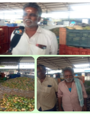
యజమానులు వాంఛితున్నారు. చంద్రబాబు నాయుడు రైతులంటే పట్టదా... అర్థం కాక ఇబ్బందులు పడుతున్నాడు.. రైతు ఏడాది పాటు మామిడి చెట్టును నీళ్ళ కట్టి. ఎరువులు వేసి. మామిడి చెట్టుకు మందు కొట్టి. అప్పటి సర్వీ చేసినందుంచిన పంట కి గిట్టుబాటు లేక సంవత్సరం అంతా కష్టపడి రెండు రూపాయల కేజీ మారు రూపాయల కేజీ అమ్ముకుంటే ఎలా బతకాలి అర్థం కాని పరిస్థితిలో రైతులను వాము పోతున్నారు. ఇలా అయితే రైతులు ఎలా బతకాలి దేవర. ఇప్పటికైనా ఆలోచించి రైతులకు ప్రభుత్వం

2.రూపాయలు 50 వైసెలు. 3. రూపాయలు అమ్ముతున్నారు. దీనికి కమిషన్ దీనికి కమిషన్. మామిడి తోపు నుండి తీసుకొన్న ట్రాక్టర్ బాడిగ.కోక కాలి. వారికి భోజనము. టిఫిను. 2.రూపాయలు గాని. 3. రూపాయలు గాని. మండి వారి ఇస్తే వారికి సరిపోతున్నది. ఇలా ఉంటే రైతులు ఎలా బతకాలి. వ్యాపారస్తులు ఎలా బ్రతకాలి. అర్థం కాని పరిస్థితిలో ఉన్నాడు. రాష్ట్ర ప్రభుత్వం. రాష్ట్ర ముఖ్యమంత్రి. నారా చంద్రబాబు నాయుడు. టీడీ పుష్పమంత్రి పవన్ కళ్యాణ్. రైతులకు గురించి పట్టించుకోవడము దారుణంగా ఉందని బంగారుపాళ్ళం మండలంలోని వ్యాపారస్తులు మండి