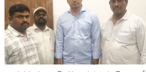
రామసుమంద్రం జూన్ 22 మనం న్యూస్ : రాజంపేట

పార్లమెంట్ సభ్యులు పి.వి. మిథున్ రెడ్డిని మండల వైఎస్సార్ కాంగ్రెస్ పార్టీ నాయకులు కార్యకర్తలు మదనపల్లి వైసీపీ పార్టీ కార్యాలయంలో మార్గాదర్శకంగా కలిశారు. ఈ సందర్భంగా వైసీపీ మండల నాయకులను ఓ.టర్ జాబితా కార్యక్రమం, పార్టీ కార్యకలాపాలు, కార్యకర్తల పరిస్థితుల గురించి మిథున్ రెడ్డి అడిగి తెలుసుకున్నారు తెలిపారు. అలాగే రానున్న స్థానిక సంస్థల ఎన్నికల నేపథ్యంలో పార్టీ బలోపేతానికి సంబంధించిన పలు అంశాలపై దిశానిర్దేశం చేశారని పేర్కొన్నారు. అనంతరం మండలంలో ఎదుర్కొంటున్న సమస్యలను మిథున్ రెడ్డి దృష్టికి తీసుకెళ్లగా, ఎంపి సానుకూలంగా స్పందించి తగిన