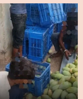
బిడి బయట పిల్లలు బిడిలోనే ఉండాలని ఉపాధ్యాయులు ఈ వేసవి సెలవుల్లో ప్రతి గ్రామంలో చుట్టి బిడిలో చేర్చించండి అంటూ తూ తూ మంత్రంగా ప్రచారం చేసారే తప్ప ఏ ఒక్క ఉపాధ్యాయులకు కూడా పట్టించుకోవడం లేదని విమర్శలు వస్తున్నాయి. మండలంలో ఉన్న గుట్టపరిశ్రమల వద్ద వెళ్ళకపోవడంతో ఇష్టానుసారంగా పిల్లల చేత పనులు చేయించుకుంటున్నారు. మామిడిపండ్ల సీజన్ వచ్చిందంటే సుమారు రెండు మూడు నెలల వరకు ఇతర రాష్ట్రాల నుండి పిల్లలను తీసుకొని వచ్చే పనులు చేయించుకుంటున్నా, దీనిని నిర్మూలించాలంటే అధికారులు ప్రత్యేకమైన శ్రద్ధ తీసుకొని గుట్ట పరిశ్రమలను పర్యవేక్షణ చేస్తే తప్ప ఇలాంటి సంఘటనలు చోటు చోటు చేసుకోదనిపలుపురు అంటున్నారు. ఇప్పటికైనా మండల స్థాయి అధికారులు మామిడి గుట్టపరిశ్రమలో పర్యవేక్షణ చేసి బాల కార్మికులకు విముక్తి కల్పించాలని పలువురు కోరుతున్నారు.

పూతలపట్టణ జూన్ 24 మనం స్టూన్: బాల కార్మికుల వ్యవస్థను నిర్మూలించాలి, బాల కార్మికుల లేని దేశాన్ని, రాష్ట్రాన్ని, స్థానిక దేశస్థాయి సుండి, రాష్ట్రస్థాయి, జిల్లా స్థాయి మండల స్థాయి వరకు అధికారులు ప్రకటనలు చేస్తూ ప్రగల్ బాలు పలుకుతున్నారే తప్ప అదరణలో ఏమాత్రం నోచుకో లేదు. బిడిలో ఉండాలిని పిల్లలు బాల కార్మికులుగా మారుతున్నారు. ఇందుకు నిద్రపర్చుతూ ప్రకటనలు మండలంలోని మామిడి పండ్లు గుట్టపరిశ్రమలో బాల కార్మికులు పనులు చేస్తున్న పట్టించుకునే నాధుడే కరువయ్యారు. మండలంలోని సుమారు 5 మామిడి గుట్టపరిశ్రమలు ఉన్నాయి. అందులో పనిచేయడం కోసం కాంట్రాక్టర్లు ఆస్పాం, రాజస్థాన్, నుండి కార్మికులను తీసుకొని వచ్చే పనులు చేపిస్తూ ఉంటారు. అందులో అధిక సంఖ్యలో బాల కార్మికులను తీసుకు వచ్చి గుట్ట పరిశ్రమలో పనులు చేపించి పరిశ్రమల యజమానుల దగ్గర అధిక మొత్తంలో వసూలు చేసుకుని బాల కార్మికులైన పిల్లలకు కొంత మొత్తం చెల్లించి లక్షల దండంకుంటున్నారు. మండలంలో ఉన్న పరిశ్రమలను మండల స్థాయి అధికారులు కానీ ఇంజనీర్ల వర్గవేక్షణ చేయకూడం ఉండడంతో యజమానులు ఇష్టానుసారంగా పిల్లలు చేత పనులు చేయించుకుంటారు.