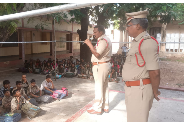
చేరి వెంటనే సహాయం అందుతుందని వివరించారు. ప్రతి యాజమాన్యం, అధ్యాపకులు, విద్యార్థినులు పోలీసు సిబ్బంది విద్యార్థిని శక్తి యాప్ ను తమ మొబైల్ ఫోన్ లో డౌన్ లోడ్ చేసుకుని పాల్గొన్నారు.