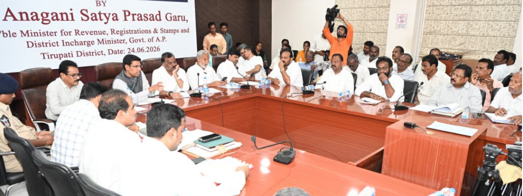
తిరుపతిలో దీర్ఘకాలిక భూ సమస్యల పరిష్కారానికి