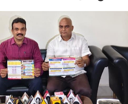
ప్యాకేజీ అయోధ్య-కాశీ పుణ్యక్షేత్ర యాత్ర ఆగస్టు 4 నుంచి 13 వరకు నిర్వహించనున్నారు. పూర్తి, కోణార్క, గయా, వారణాసి, అయోధ్య, ప్రయాగరాజ్ ప్రాంతాలను ఈ యాత్రలో