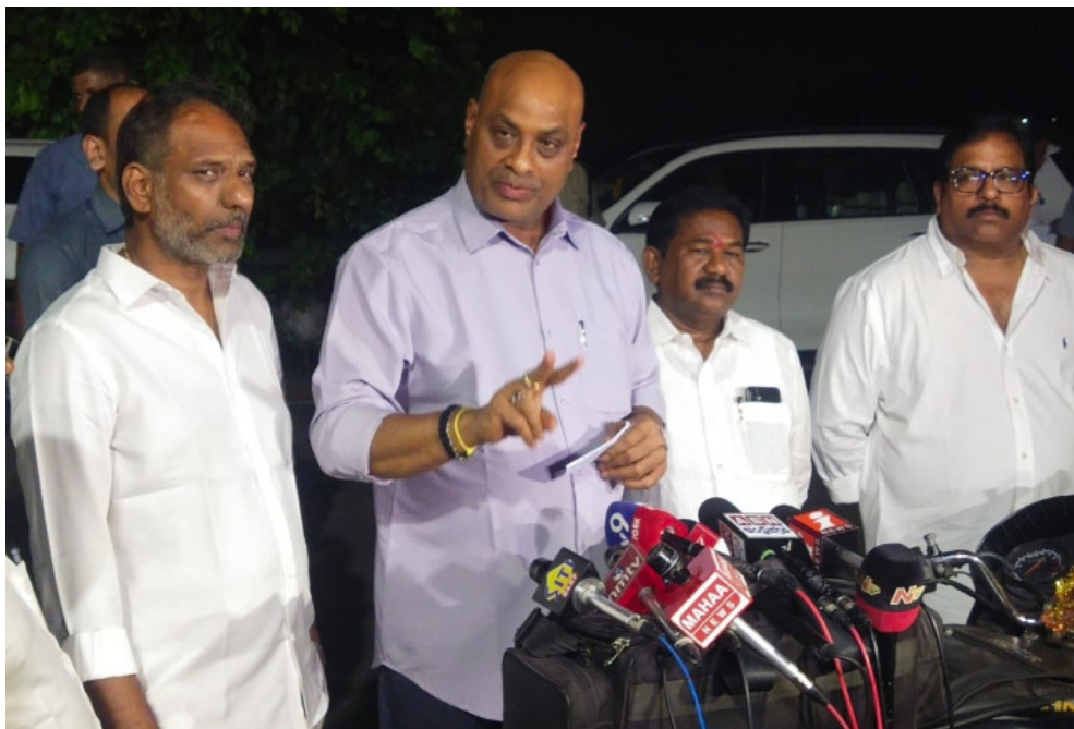
రైతులకు ముందస్తు మార్గదర్శకాలు అందించే చర్యలు చేపడతామని తెలిపారు.

అంతర్జాతీయ మార్కెట్లలో వర్షినియా పొగాకు ఉత్పత్తి పెరగడం, ఎగుమతి పరిస్థితులు మారడం వల్ల ధరలు ప్రభావితమైనప్పటికీ రైతులకు నష్టం జరగకుండా చర్యలు తీసుకోవాలని సీఎం స్పష్టమైన ఆదేశాలు ఇచ్చారని చెప్పారు. పొగాకు వేలం కేంద్రాల్లో అన్ని కొనుగోలు సంస్థలు తప్పనిసరిగా పాల్గొనాలని, పొగాకు బోర్డు పరిధిలోని అన్ని ప్లాట్ ఫారమ్లు పూర్తిస్థాయిలో పనిచేయాలని ప్రభుత్వం ఆదేశించిందన్నారు. రైతులు తీసుకొచ్చిన పొగాకును తిరస్కరించే పరిస్థితి ఉండకూడదని, మార్కెట్లో పొగాకు రకం ఏదైనా కిలో రూ.200 కంటే తగ్గడానికి వీలేదని సీఎం ఆదేశించారని, పొగాకు రైతులు ఆందోళన చెందాల్సిన అవసరం లేదని మంత్రి భరోసా ఇచ్చారు. వేలం కేంద్రాల వెలుపల జరిగే అసాధికార కొనుగోళ్లపై కఠిన చర్యలు తీసుకుంటామని, అవసరమైతే క్రిమినల్ కేసులు కూడా నమోదు చేస్తామని హెచ్చరించారు. అదేవిధంగా భవిష్యత్తులో మార్కెట్ అవసరాలకు అనుగుణంగా సాగు విస్తీర్ణంపై