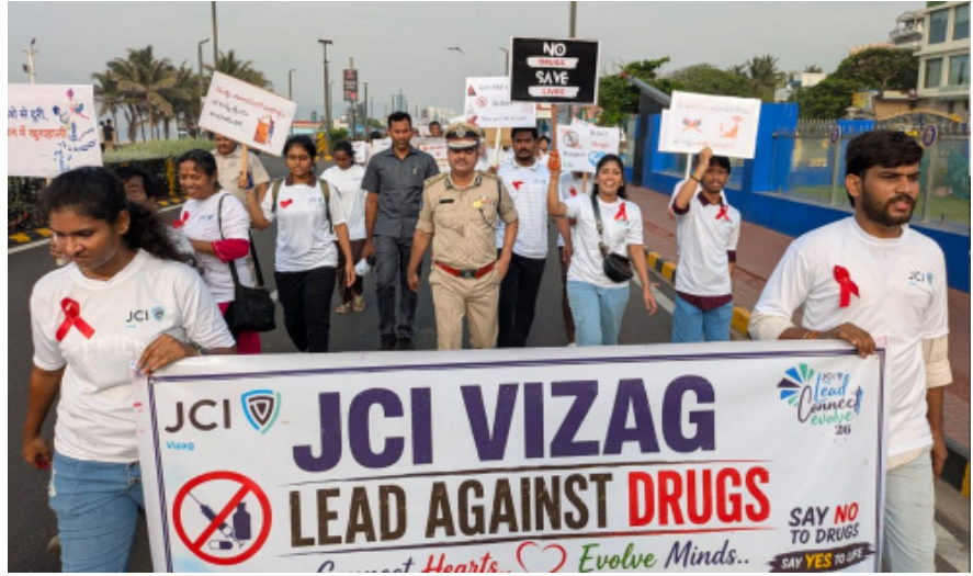
మిస్సెస్ ఏ.వి.ఎన్. కళాశాల విద్యార్థులు, వైజాగ్ ఫిల్మ్ సొసైటీ సభ్యులు, యువకులతో ఈ కార్యక్రమం విజయవంతమైంది.