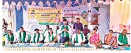
బుక్కరాయసముద్రం, జూన్ 20 మనం న్యూస్:

■ ఒక్క శింగనమల నియోజకవర్గం లోనే రూ. 9.42 కోట్ల నిధులు విడుదల ■ ఎమ్మెల్యే శ్రావణికి కలెక్టర్ ఓ ఆఫీసుకు రైతుల హాటెలు