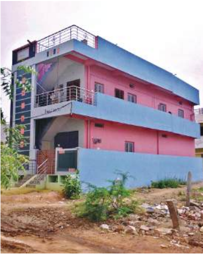
డబుల్ రిజిస్ట్రేషన్ చేసే దళితుల స్థలంలో నిర్మించిన ఇల్లు. అక్రమనకు గురైన స్థలం

అనంతపురం జూన్ 21 మనసూయ్ : అనంతపురం జిల్లా పామిడి సబ్ రిజిస్ట్రార్ కార్యాలయంలో గతంలో జరిగిన అక్రమాలు ఒక్కక్కటి బయటకు వస్తున్నాయి. 2001లో పామిడి సర్వే నంబర్ 469,470,471,491లో దళితులకు రిజిస్ట్రేషన్ అయిన స్థలాన్ని డబుల్ రిజిస్ట్రేషన్ తో