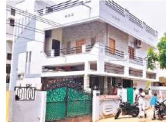
కళ్యాణదుర్గం టౌన్ జూన్ 21 మనసూయాన్: