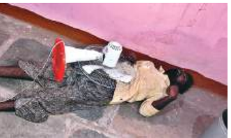
డి. హీరోహాళ జూన్ 22