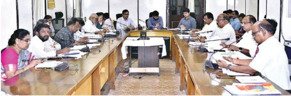
వీడియో కాన్ఫరెన్స్లో జిల్లా కలెక్టర్ ఓ.ఆనంద్

అనంతపురం, కలెక్టరేట్ జూన్ 22 మనం న్యూస్ : అత్యంత నాణ్యతగా పిజిఆర్ఎస్ అర్జీలను పరిష్కరించడం చేయాలని జిల్లా కలెక్టర్ ఓ.ఆనంద్ సంబంధిత అధికారులను ఆదేశించారు. సోమవారం సాయంత్రం అనంతపురం కలెక్టరేట్ లోని మినీ కాన్ఫరెన్స్ హాల్ నుంచి ప్రజా సమస్యల పరిష్కార వేదిక (వబ్లీక్ గ్రీవెన్స్ రిడ్రెస్లెట్ సిస్టం, పిజిఆర్ఎస్), ఎన్ఆర్ఈజిపి, అక్షర ఆంధ్ర, రీసర్చ్, పట్టాదారు పాస్ పుస్తకాల పంపిణీ, హాసింగ్, జలధార, పీఎంసూర్యపుర, అగ్రికల్చర్, జి.ఎస్.డబ్ల్యు.ఎస్, తదితర అంశాలపై ఆయా శాఖల జిల్లా అధికారులు, ఆర్డీఓలు మున్సిపల్ కమిషనర్లు, తహసీల్దార్లు, ఎంపీడిఓలు, ఎపిడిలు, ఎపిఓలు, సంబంధిత శాఖల మండల అధికారులతో వీడియో కాన్ఫరెన్స్ ద్వారా జాయింట్ కలెక్టర్ సి.విష్ణుచరణ్ తో కలిసి జిల్లా కలెక్టర్ సమీక్ష నిర్వహించారు. ఈ సందర్భంగా జిల్లా కలెక్టర్ మాట్లాడుతూ పిజిఆర్ ఎస్, రెవెన్యూ క్లీనిక్ లకు సంబంధించి పరిష్కరించిన గ్రీవెన్స్ లను సరిగా పరిష్కరించడం లేదని, గ్రీవెన్స్ పరిష్కరించిన అనంతరం ఆడిట్ టీం అర్జీదారుడి సంతృప్తి స్థాయిని తెలుసుకోవడం జరుగుతుందని, నాణ్యతగా